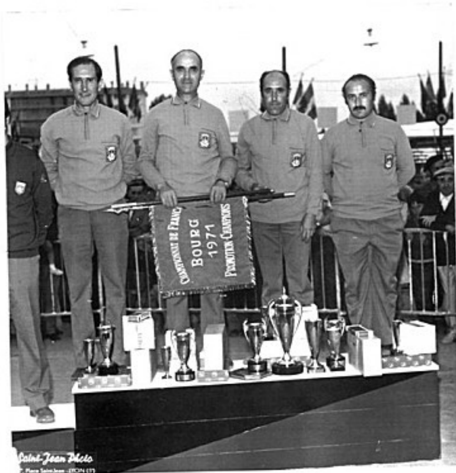
Saint Jean Metz 7, Place Saint-Jean - (70211) (17)